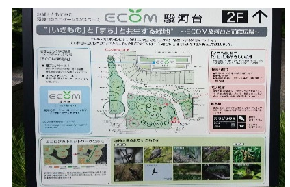
E COM駿河台ビルと前庭広場案内板 (いきものとまちと共生する緑地)

企業価値や不動産ならびに商品の価値向上を目的に、現在では三菱地所、東急不動産、森ビル、花王、イオンなどの事業者様が、工場緑地や都市開発事業において、生物多様性に配慮した環境保全や緑地計画の取り組みを積極的に行い、 ABINC認証 を取得しております。 今後、更に人と自然が共生する環境づくりの実現に企業活動として参加する事業者様が增多することが予想されるため、株式会社かたばみは認証取得に対する技術的な提案を、積極的に行なってまいります。